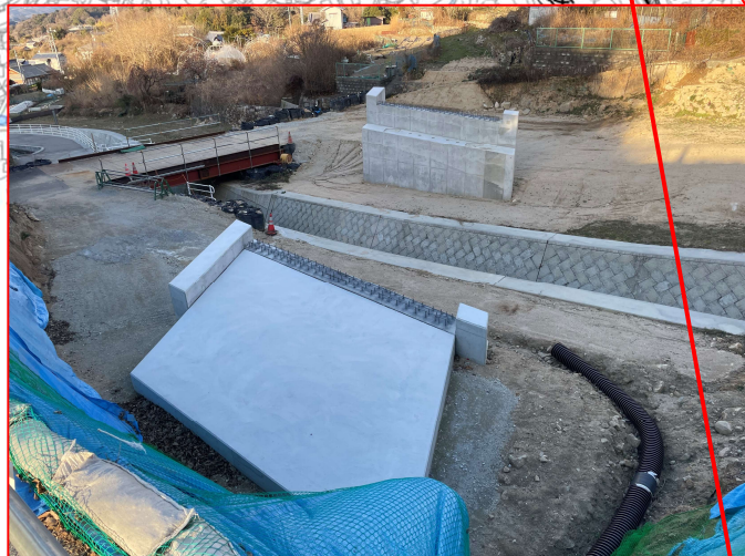
▲坂東環状線（仮称）明神橋橋梁下部工事（完）