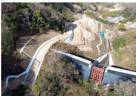
▲安芸南部山系付替町道坂・小屋浦線道路改良工事 町道坂・小屋浦線の付替道路を施工しています。