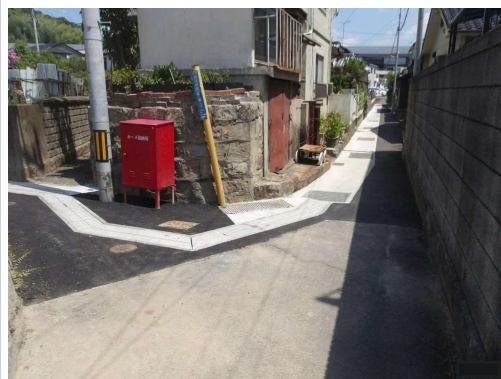
◀横浜排水区雨水排水路改良(その3)工事(完)

現在、斜面を掘削して整形しています。 (工事期間：令和7年11月～令和8年10月)