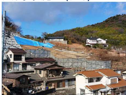
◀横浜6244地区急傾斜地崩壊対策工事

現在、斜面を掘削して整形しています。 (工事期間：令和7年11月～令和8年10月)