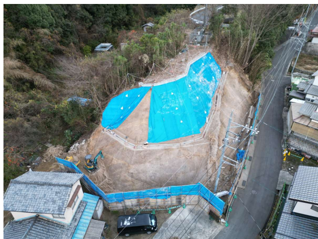
◀西嶽7518地区急傾斜地崩壊対策工事