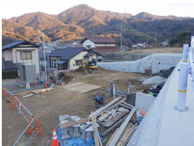
◀西側9号線道路改良工事