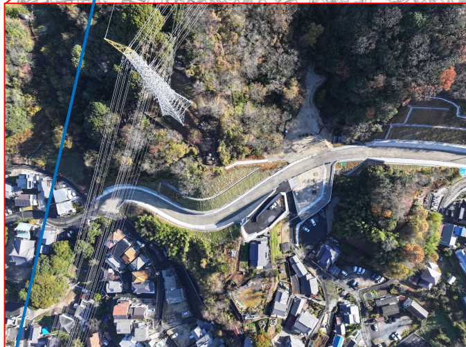
▲坂東環状線道路改良（その3）工事（完）