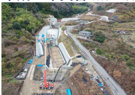
▲安芸南部山系総頭川遊砂地第2工事 土砂洪水氾濫対策として遊砂地を施工しています。