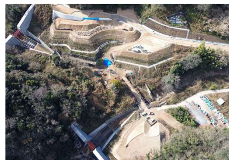
▲安芸南部山系管内整備工事 町道取付道路の施工を行っています。