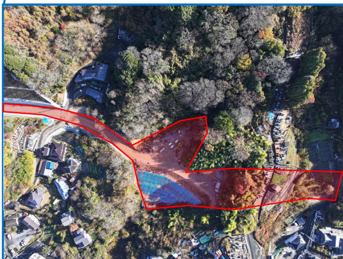
▲坂東環状線道路改良（その4）工事