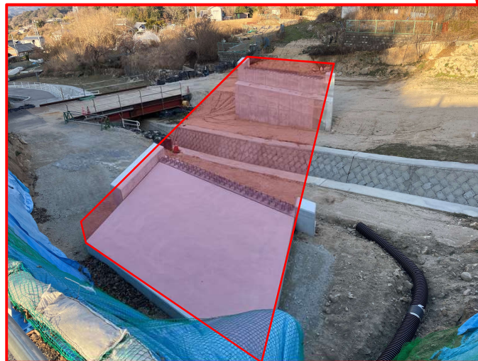
▲坂東環状線（仮称）明神橋橋梁上部工事