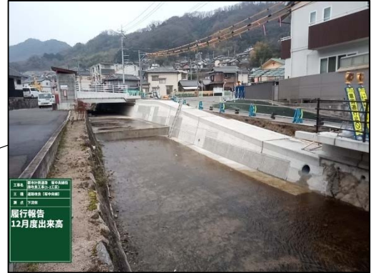
ボックスカルバート③施工状況