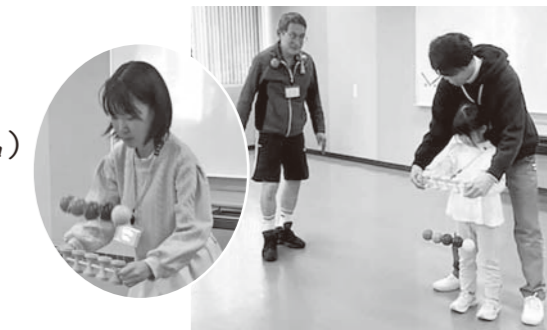
5連けん玉でお皿に何個のるか、挑戦したよ。