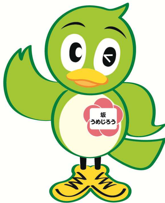
坂町マスコットキャラクター 坂うめじろう