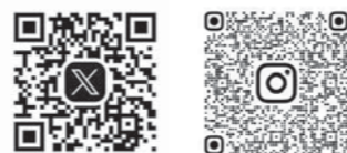
情報を発信中です。

※地域おこし協力隊は、都市地域から移住して、地場製品の開発やPR等の地域おこし支援を行いながら、その地域への定着・定住を図る国の取組です。