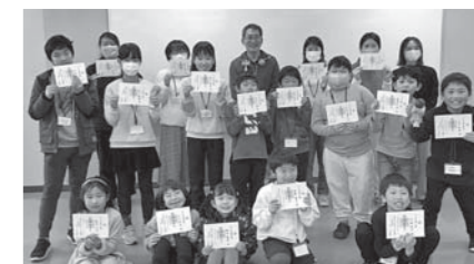
いろんな技をできるようになったよ! (昨年度、最後のけん玉教室にて)

けん玉教室の今後の開催予定(いずれも土曜の13時～15時) 7月20日、9月21日、12月7日、1月18日、3月1日