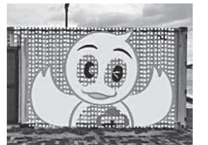
株式会社ZIGENライティングソリューション LEDイルミネーション