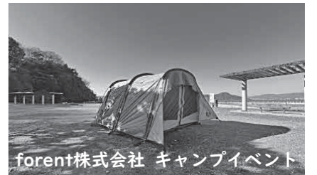
forent株式会社 キャンプイベント

全国の革新的な技術を持つスタートアップ企業と市町のマッチングにより、共同で地域課題の解決を目指す広島県「スタートアップ共同調達推進事業」を通じ、坂町は、秋祭りを題材にした壁画アート制作、ベイサイドビーチ坂でのキャンプイベントとLEDイルミネーション事業の協業案3件を採択しました。今年度、これらの協業案をベースに本町の魅力を広くPRし、地域の賑わい創出につなげる実証実験にチャレンジしていきます。