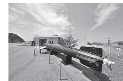
阿多田交流館（イメージ）