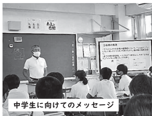
中学生に向けてのメッセージ