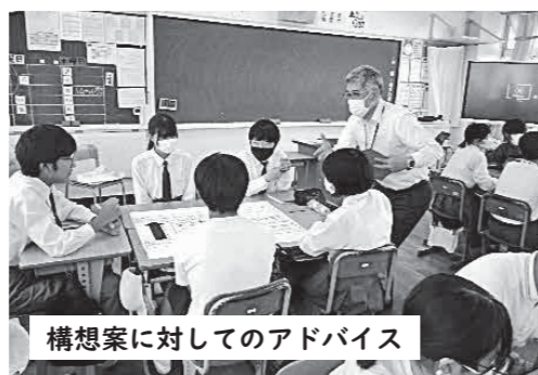
構想案に対するアドバイス

学校運営協議会とは、学校と保護者や地域が、ともに知恵を出し合い、子どもたちの豊かな成長を支え、「地域とともにある学校づくり」を進める仕組みです。今回は、坂中学校の活動を紹介します。