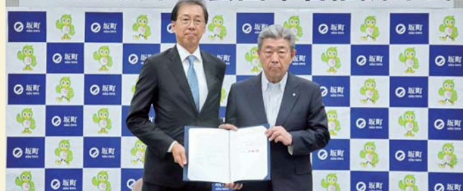
▲左から 野口取締役兼常務執行役員、吉田町長