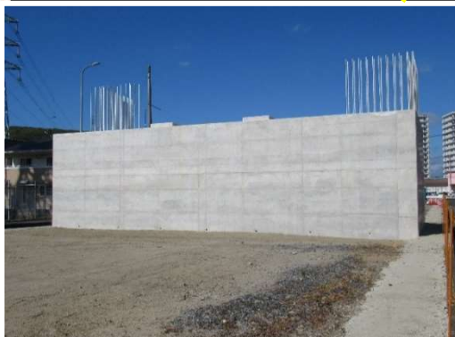
橋台の躯体工事 (役場付近)