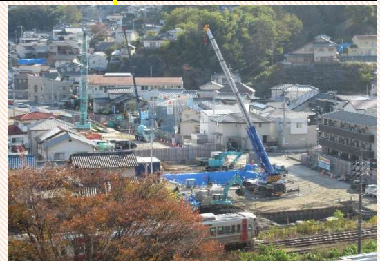
橋脚の杭打ち工事 (丸子児童遊園地)