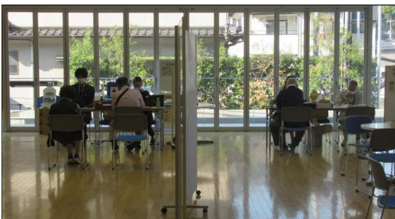
集団調印会場の様子

今後も広島県と共に、早期完成に向けて取り組んでまいりますので、引き続き皆様のご理解とご協力をお願いいたします。