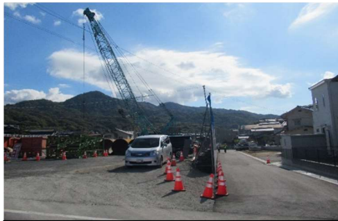
橋脚の杭打ち工事 (保健センター付近)

引き続き、高架橋の工事を進めて参りますので、皆様のご理解とご協力をお願いいたします。