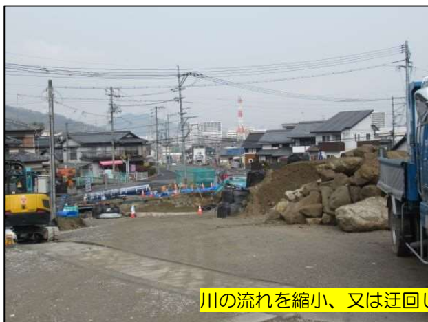
川の流れを縮小、又は迂回して、護岸の工事から施工します。