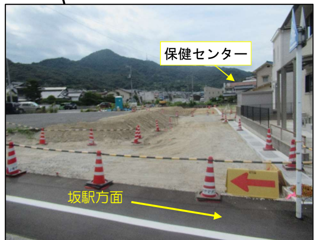
保健センター付近の側道の整備に着手して います。