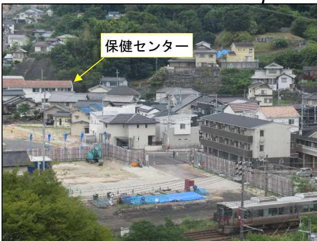
丸子児童遊園地があった箇所は、橋脚の基礎 工事に着手しています。