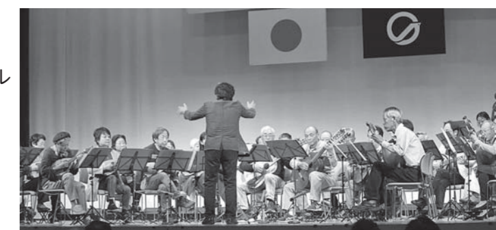
▲坂マンドリンクラブ(坂町文化祭にて)