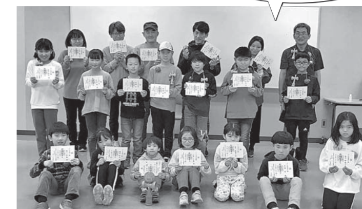
いろんな技ができるようになったよ! (昨年度、最後の教室にて)