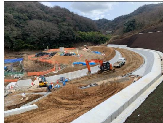
※下流側砂防堰堤の工事用道路工事 亀石川(亀石山：広島県施工)