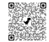
↑八幡神社へはこちらのQRから

今からおおよそ750年前、甲州より鎮座されたといわれており、古くから、五穀豊穰・家内安全・武運長久の守り神として崇められてきました。石造りの鳥居は、昭和6年に建立奉納されたもので、それ以前は、厳島神社の大鳥居と同じ様式の木造の両部鳥居であったといわれています。