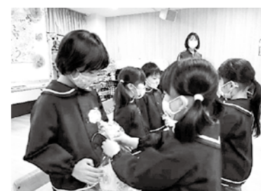
「ひまわりぐみさん ありがとう」

新しい環境の中で、自分がチャレンジしたいことに向かって取り組んでいき、仲間と相談したり、協力しながら実現していく力を育み、自信を持って、新しいスタートをきってほしいと思います。