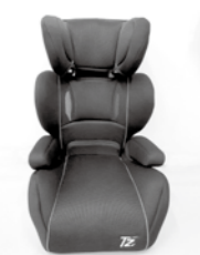
ジュニアシート (3歳～6歳未満)