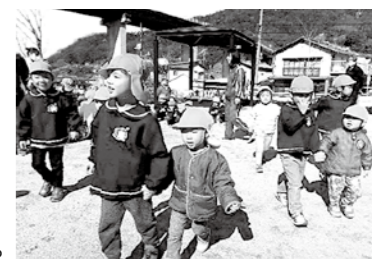
公園に着いたらお宝探しに Go!

保育園から巣立ち、4月から小学校に通う年長児とのお別れ、思い出づくり企画として「おわかれパーティ、おわかれ散歩」を楽しみました。小屋浦公園までの道のりを年長児は、小さいクラスの子の歩幅に合わせて歩き、時折顔を覗き込んで、おしゃべりをしたり、危ない時には声をかけたり、優しさいっぱい姿でした。公園に着くと、お楽しみの「宝さがし」がスタート。小さいクラスの子が、自分で見つけられるように側で見守ったり、お宝が見つかる、一緒になって喜んでいました。保育園に帰ると、2・3・4歳児が「ひまわり組さんありがとう！小学校に行ってもがんばってね。」という気持ちを込めて作った、えんぴつ立てをプレゼントしました。就学や進級することに、わくわくドキドキ、嬉しい気持ちがいっぱいの子どもたちですが、不安な気持ちを感じる子もいます。