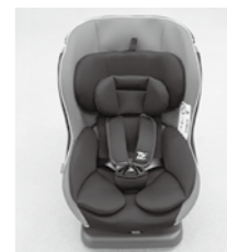
チャイルドシート (新生児～4歳頃まで)

申込方法 所定の申請書に必要事項をご記入のうえ、役場民生課へお申し込みください。