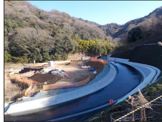
※下流側砂防堰堤の工事用道路工事 水尻川支川4 (水尻：広島県施工)