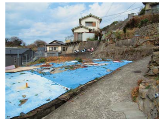
完成が待たれる横浜西の道路改良工事

町長 町道拡幅を行う道路改良事業で、令和2年度に測量、3年度に設計・用地買収、4年度に工事を行う計画としていた。この事業の用地境界立会を令和3年度に行ったが、その中で公図地番と現況地番に不整合があることが判明し、この調査や解決検討に時間を要している。