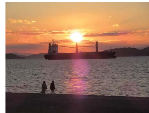
ベイサイドビーチ坂物販施設の賑わい創出を

町長 (株)モンベルと(株)スタックがテナントとして入居し、オープン後は、シーカヤックなどのマリンスポーツ、背後地でのトレッキングなど、さらに飲食や特産品やグッズ販売による町の魅力発信など、本町を象徴する施設として、海・山・ビーチを活用したアウトドアのメッカとなるよう発展させていく。