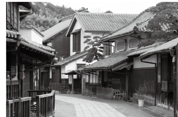
▲たけはら町並み保存地区(イメージ)