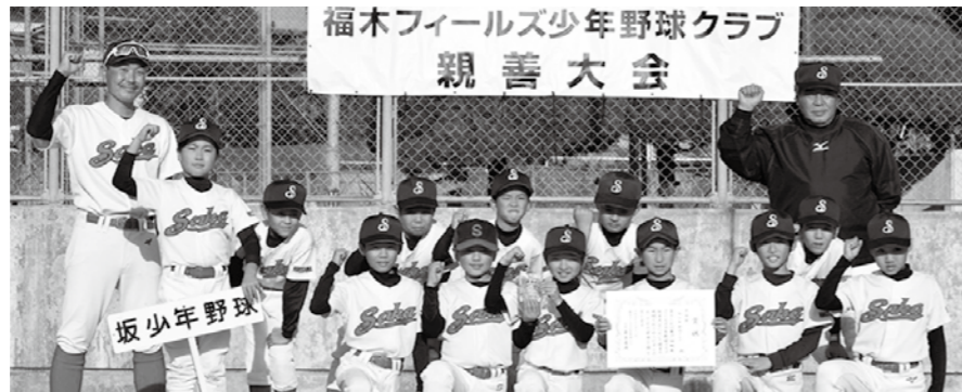
▲坂軟式野球スポーツ少年団(4年生以下)

12月11日(日)に福木フィールズ少年野球クラブ親善大会 フィールズ杯が開催され、坂軟式野球スポーツ少年団(4年生以下)が準優勝しました。