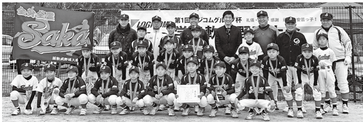
▲坂軟式野球スポーツ少年団

12月17日(土)に北新地グラウンドで、第1回ロジコムグループ杯学童軟式野球大会が開催され、坂軟式野球スポーツ少年団が準優勝しました。