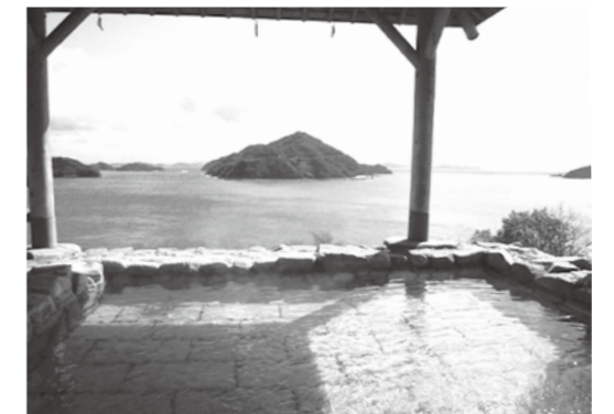
▲きのえ温泉ホテル清風館露天風呂