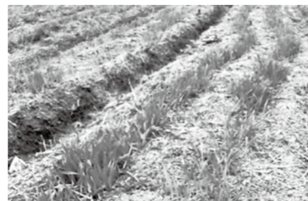
▲1月上旬のムラサキ麦の生育状況