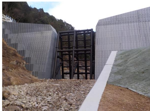
水尻川支川3 (水尻：広島県施工)