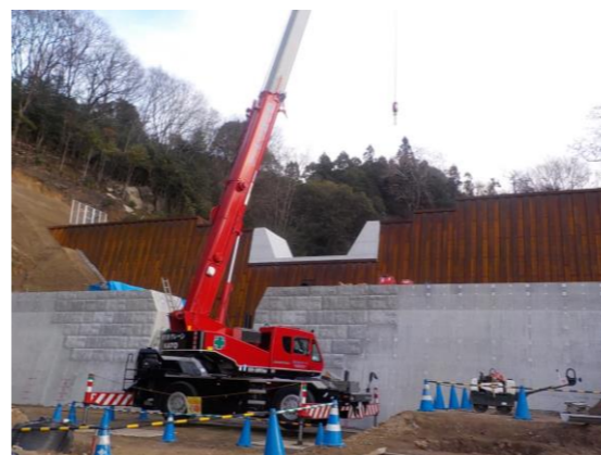
亀石川(亀石山：広島県施工)

現在、町内の各地区で復旧・復興工事を進めています。小屋浦地区では、広島県が施工する天地川支川(I-1)の工事が完成しました。また、植田地区の手切川では、令和5年3月に治山堰堤工事に着手予定です。今後も被災箇所への復旧・復興に全力をあげて取り組んでまいりますので、ご理解とご協力をよろしくお願ひします。