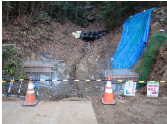
天地川支川3(小屋浦四丁目：広島県施工)