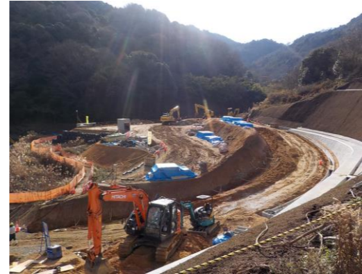
※下流側砂防堰堤の工事用道路工事