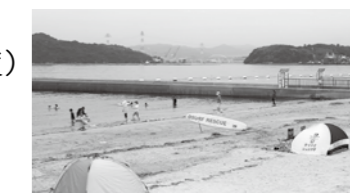
▲ベイサイドビーチ坂