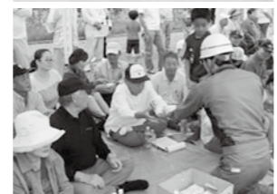
▲総合防災訓練(平成27年の様子)