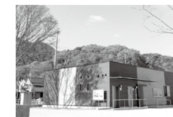
▲坂町災害伝承ホール

坂町災害伝承ホール開館(令和4年4月30日開館) 河川監視カメラ設置工事(明神川) 道路等公共土木施設災害復旧工事(平成30年度～継続中) 町道整備事業(坂東環状線、(仮称)小屋浦四丁目線、浜田中洲線、 横浜一部15号線、横浜三部2・6・7・8号線、刎4号線、藤之脇1号線、 久保田川線、西側9号線道路改良工事) (仮称)町道植田水尻側道線道路新設事業(測量、設計、用地、工事) 県道坂小屋浦線整備事業(平成8年度～継続中 都市計画決定:平成13年3月) 海岸保全施設整備事業(平成19年度～継続中) アサガミ前護岸、森山北防波堤、ベイサイドビーチ坂連絡橋(水尻駅～ベイサイドビーチ坂)、 ベイサイドビーチ坂トイレ改修 港湾施設維持管理事業(植田浮消波堤修繕工事)(令和2年度～令和4年度) ベイサイドビーチ坂物販施設等整備工事(令和2年度～令和4年度) ベイサイドビーチ坂維持管理事業(県から陸地部分の管理を受託) 天地川堆積土砂撤去工事 急傾斜地崩壊対策事業 坂西三丁目3地区(令和元年度～継続中)、横浜西二丁目1地区(令和2年度～継続中)、 田島地区(令和2年度～令和4年度)、横浜西6244地区(令和3年度～継続中)、水尻9063地区(新規) 津波災害一時避難場所整備工事(場所:横浜中央二丁目 平成29年度～令和4年度) 横浜排水区浸水対策事業(氾濫解析業務、雨水排水路詳細設計業務、雨水排水路改良工事) 横浜公園遊具更新工事 横浜公園法面改修工事