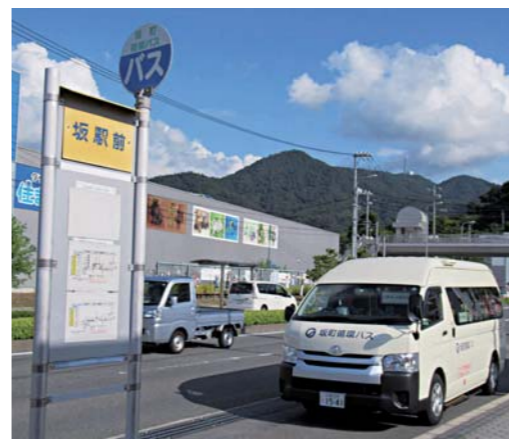
土日運行が待たれる循環バス

町長 アンケート結果や休日開催される町主催事業への交通手段の必要性などを考慮し、今後の収支見通しおよび町財政への負担を総合的に勘案した上で、運行の検討をする。