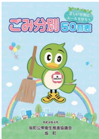
ゴミの分別にご協力を