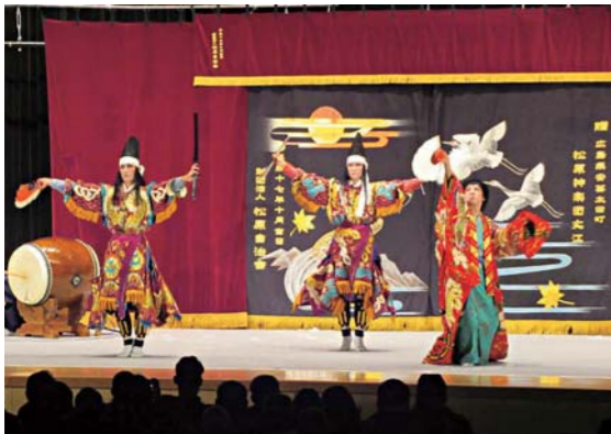
神楽などの喜ばれるイベントを