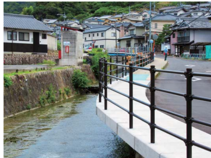
整備されつつある張出歩道

町長 仮設の大型土のうや、転落防止策の設置を行い、護岸や張出歩道の応急対策を実施し、荒神橋から向井田橋までの被災道路兼用護岸や張出歩道を復旧する。