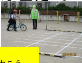
踏切は押して歩こう