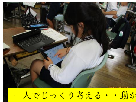
一人でじっくり考える・・・動かしたり、別の方法を試したり、ノートよりも簡単に使えるよ。