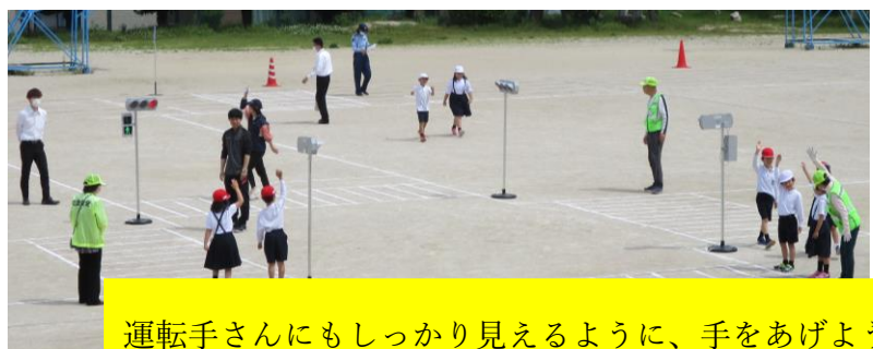
運転手さんにもしっかり見えるように、手をあげよう