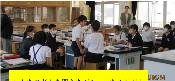
みんなの考えを聞きながら・・・なるほど!

5月24日(金)に、学校運営協議会が開かれました。学校と地域の方が力を合わせて「地域とともにある学校」にしていくために、地域の声を積極的に生かし、一体となって学校づくりを進めていきたいと思えます。授業の様子を見たり学校のめざす姿について意見をいただいたりと、学校の応援団になっていただき、とても心強いです。今後ともよろしくお願ひします。