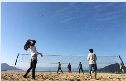
広島市近郊の住民に身近な海水浴場「バイサイドビーチ坂」は海水浴シーズン以外にも、ビーチスポーツや釣り客でにぎわっています

自宅のすぐそこに、山歩きや水遊びを楽しめる自然があります。趣味や家族との充実した時間の実現を、ぜひ坂町で。