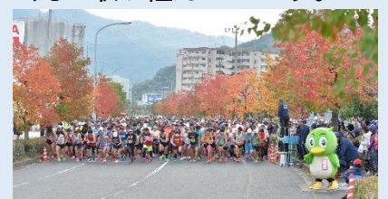
実行委員会による手作りのフルマラソン大会「広島ベイマラソン大会」の参加者は、全国各地から 1,500 人以上！

市街地の近くにありながら、昔ながらの人と人、地域のつながりが強く残るまちです。お祭りやイベントも、地域住民一丸で取り組んでいます。