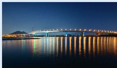
坂町と広島市を結ぶ「広島ベイブリッジ」は、夜になるとライトアップされ、美しい曲線が幻想的に浮かびます

仕事はアクセスのよい市街地で、暮らしは豊かな自然と、お店や病院が身近な坂町で。オンとオフを意識した生活の実現ができるまちです。