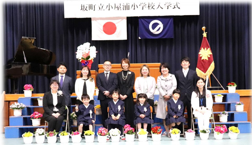
坂町立小屋浦小学校入学式