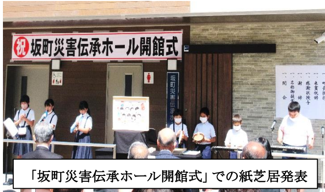
「坂町災害伝承ホール開館式」での紙芝居発表