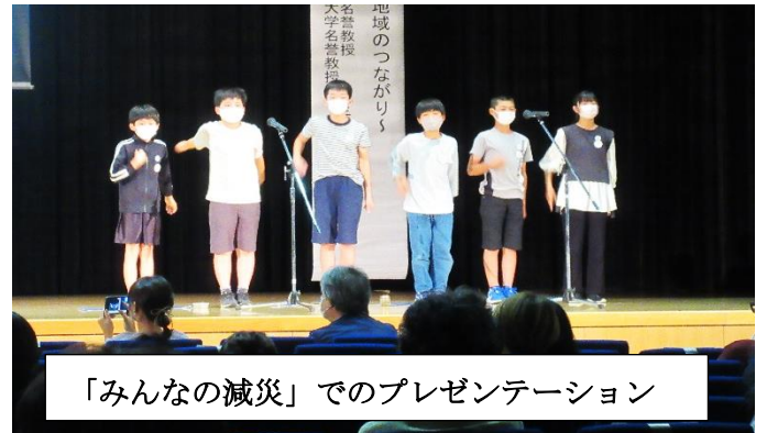
「みんなの減災」でのプレゼンテーション

5年「手作りの紙芝居」で防災の大切さを広めたい。 6年「防災マップ」で小屋浦の人々の安全を守りたい。