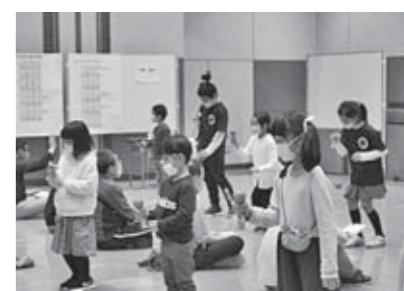
けん玉大会の様子