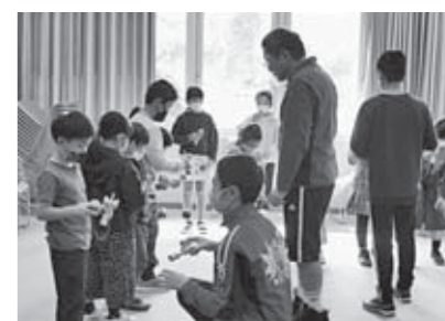
けん玉教室の様子