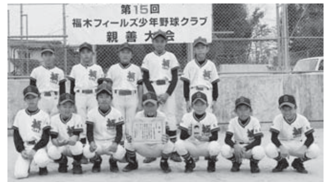
▲坂軟式野球スポーツ少年団