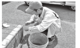
▲タイルの補修(保健センター)