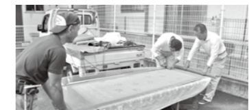
◀網戸の張替え(コミュニティホールさかな)