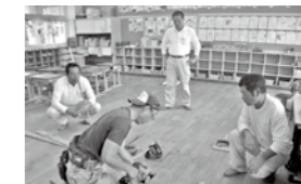
▲床の補修(坂小学校)