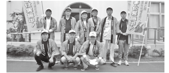
▲参加された坂支部の皆さん