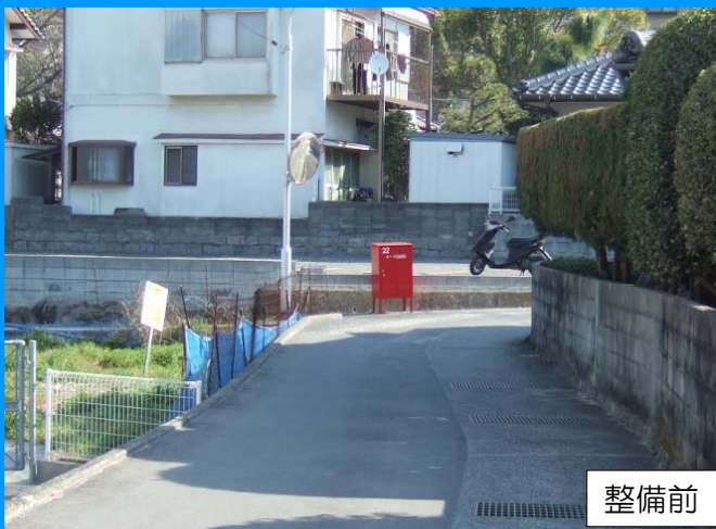
町道本手 4 号線改良 (離合箇所設置)