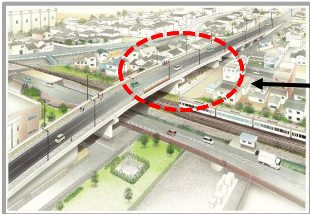
JR・国道交差部（高架部）イメージ