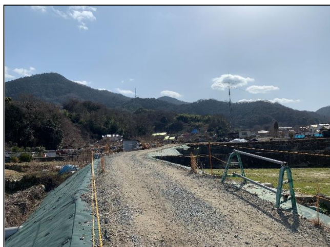
②綿打橋付近の工事用進入路から南側