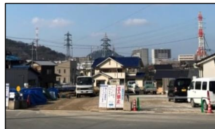
③県道坂小屋浦線工事再開付近