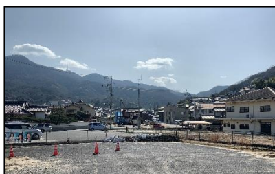
①町道浜田中洲線の副道延長付近