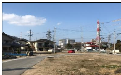
②町道小森川線の副道延長付近