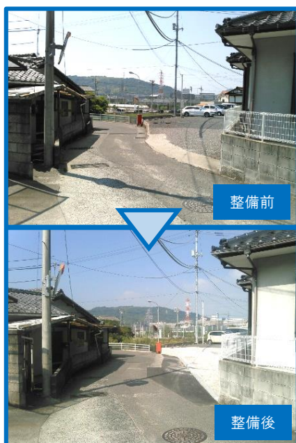
町道新張5号線改良