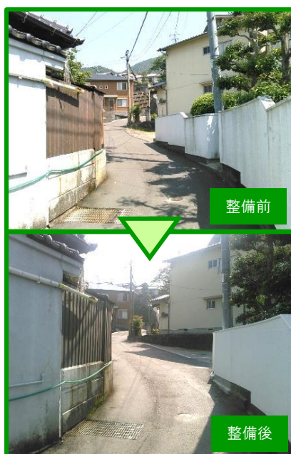
町道本手4号線改良