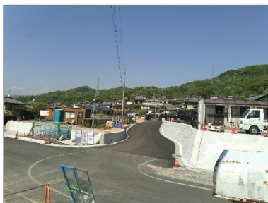
② 中村 17 号線 新設