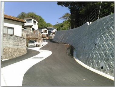
① 環状線取付道路 改良