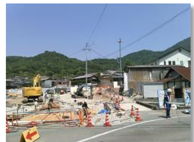
③ 中村 3 号線 改良 (荒神橋)