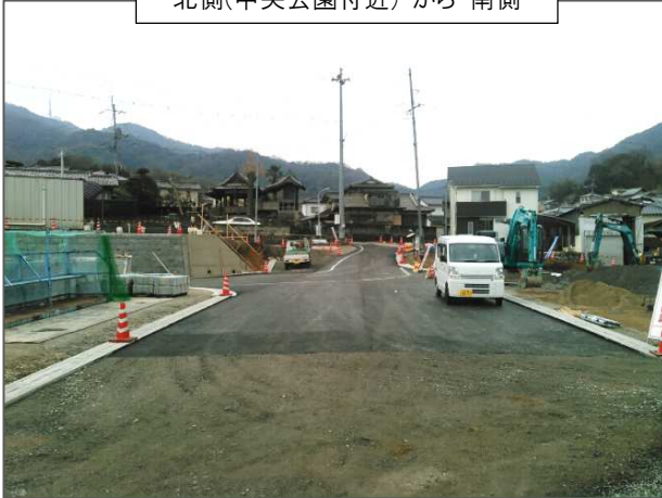
北側(中央公園付近) から 南側