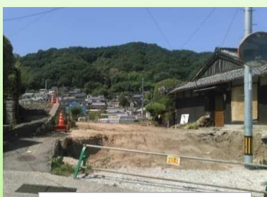
工事終点側（中村 17 号線）