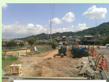
工事起点側（中村 17 号線）