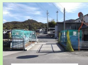
町道中村 3 号線（荒神橋）