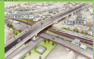
完成イメージ(JR線高架部付近)