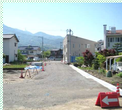
保健センター周辺の副道工事 （右端が保健センター）