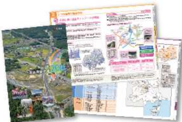
広島県道路整備計画2016