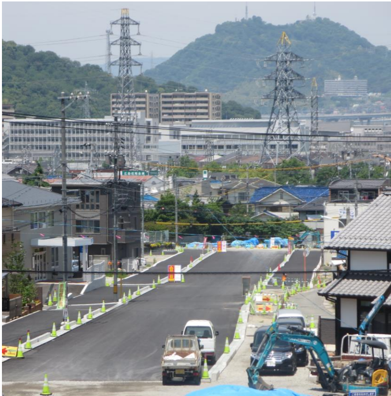
▲ほぼ出来上がった 1-2 工区 (町道総頭川 1 号線との接続まで)