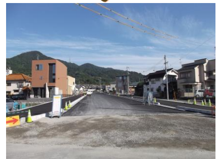
▲工事区間起点側 (1-2 工区実施分)