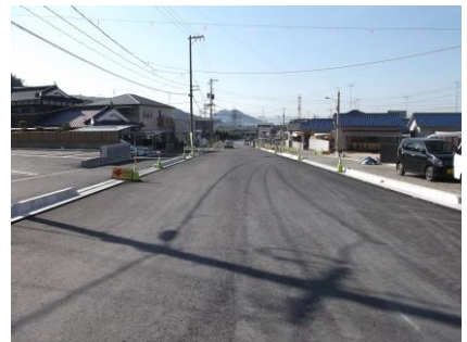
▲工事区間終点側 (1-2 工区実施分)