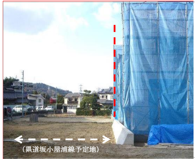
《一部工事が始まった1-2工区》