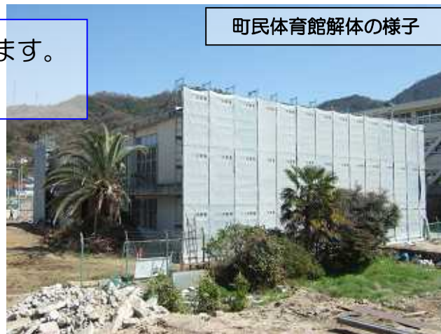
町民体育館解体の様子