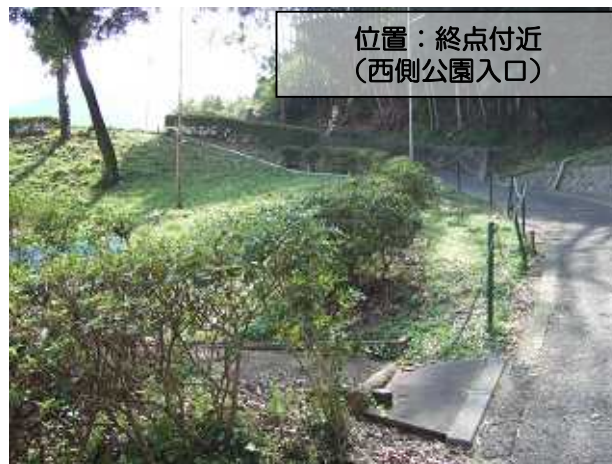
位置：終点付近 (西側公園入口)