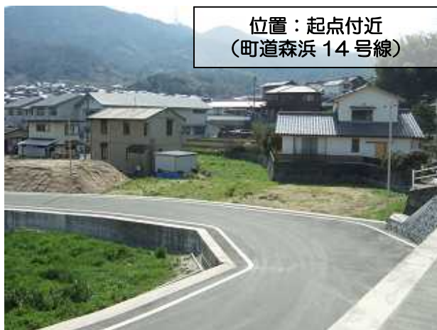
位置：起点付近 (町道森浜 14 号線)