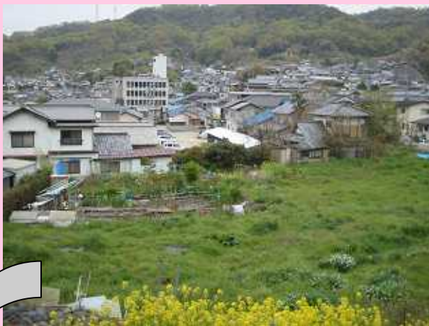
坂西二丁目地内道路新設 (町道森浜14号線)

http://www.town.saka.hiroshima.jp/sakacho/sangyoukensetsu/machikoujigyou.htm