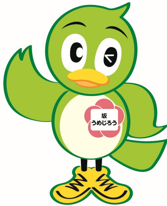
坂町マスコットキャラクター 坂うめじろう