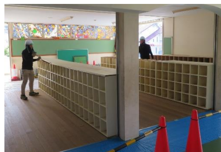
撤去中の旧靴箱（木製）

新たな靴箱の歴史は、今坂小に通っている子供たちから始まります。木製からスチール製になり、長靴も入るほど大きくなった新しい靴箱も、これから何十年、何百人の子供たちが大切に使っていきながら、新たな歴史を刻んでほしいと思います。