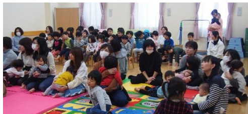
「子ども達も、お母さんも 生のピアノの音色にうっとり」

ピアノを弾かせてもらってとても楽しかったです。これからの経験を積み、ピアノの音色を極めたいです。