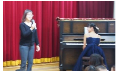
「おかあさんにもインタビュー。 “先輩ママからのお話も聞けました”