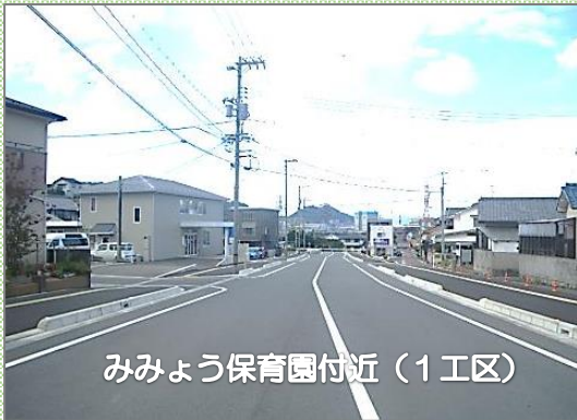
みみょう保育園付近（1工区）