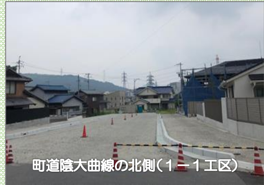
町道陰大曲線の北側（1-1工区）