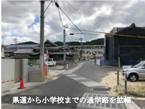
県道から小学校までの通学路を拡幅