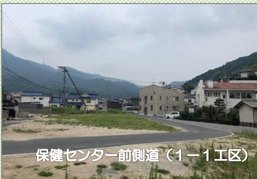
保健センター前側道（1-1工区）