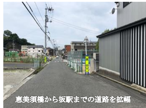
恵美須橋から坂駅までの道路を拡幅

幹線道路である町道浜田中洲線は、車両及び、歩行者の通行が多い坂駅前のメイン道路ですが、歩道が整備されておらず、狭隘区間であるため、道路の幅員を上げて歩行者の安全対策を計ります。