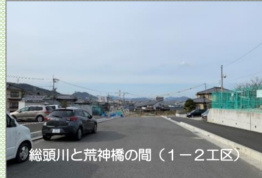
総頭川と荒神橋の間（1-2工区）